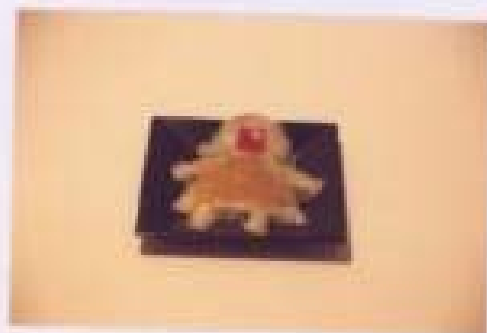
ภาพประกอบที่ 3 พื้นผิว

4. พื้นผิว พื้นผิวที่เกิดขึ้นในผลงานนั้นเป็นพื้นผิวที่มีทั้งเรียบและขรุขระ เกิดจากความคิดที่ข้าพเจ้าต้องการสะท้อนให้เห็นถึงความเป็นธรรมชาติตรงไปตรงมา ของสิ่งต่างๆ ที่เกิดขึ้นในวัฒนธรรมกับความปราณีตเป็นระเบียบซึ่งพบเห็นได้ในชีวิตประจำวัน