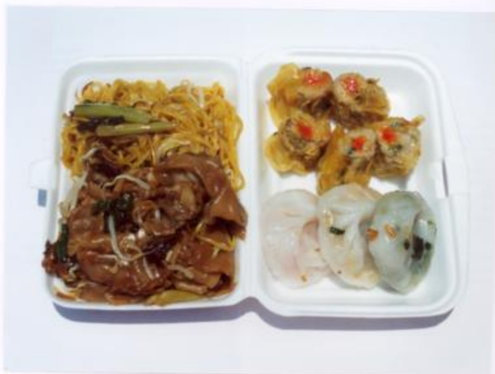
ภาพประกอบที่ 2 อาหารของคนจีน