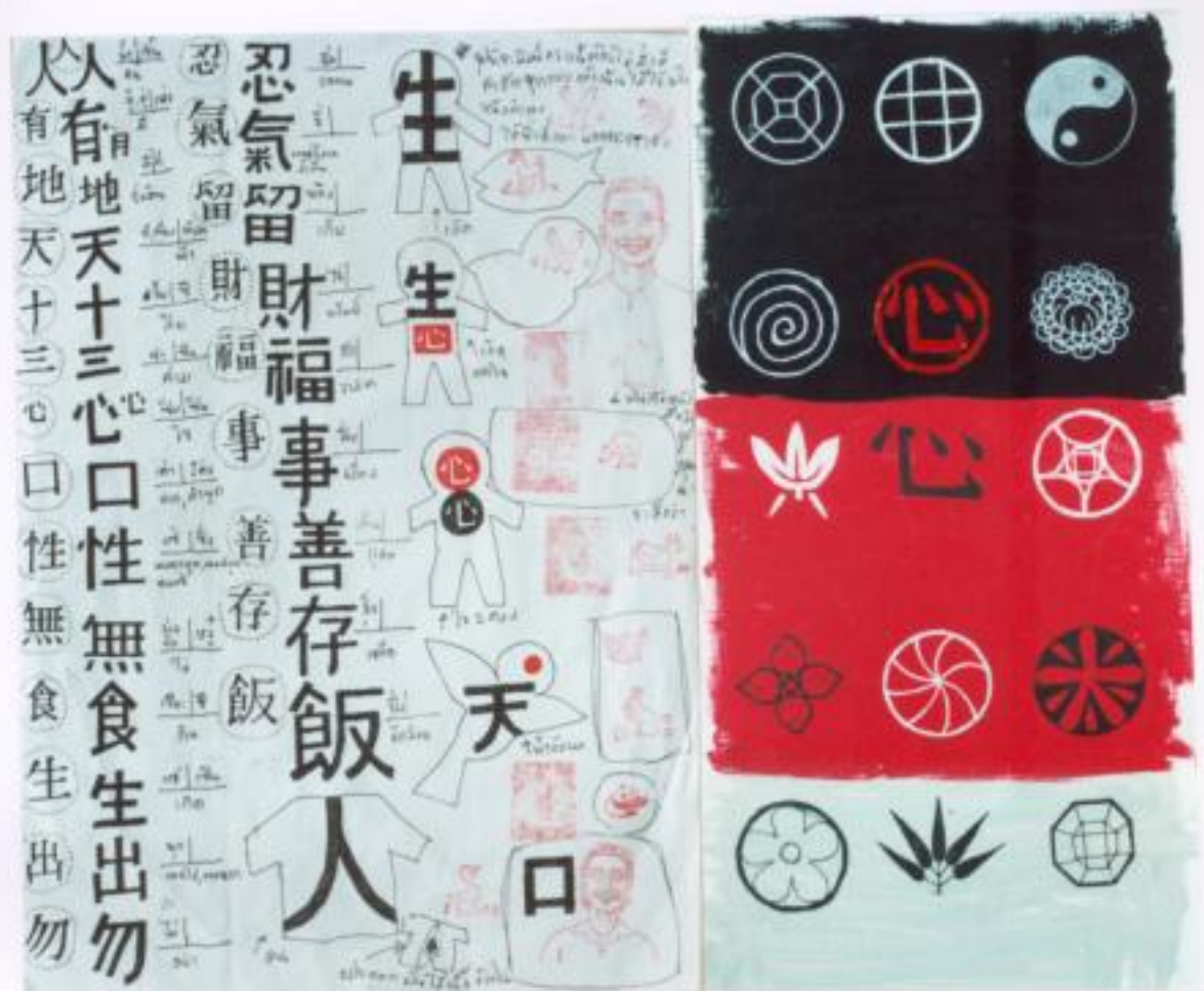
ภาพประกอบที่ 3, 4 แม่พิมพ์ประทับบนขาม