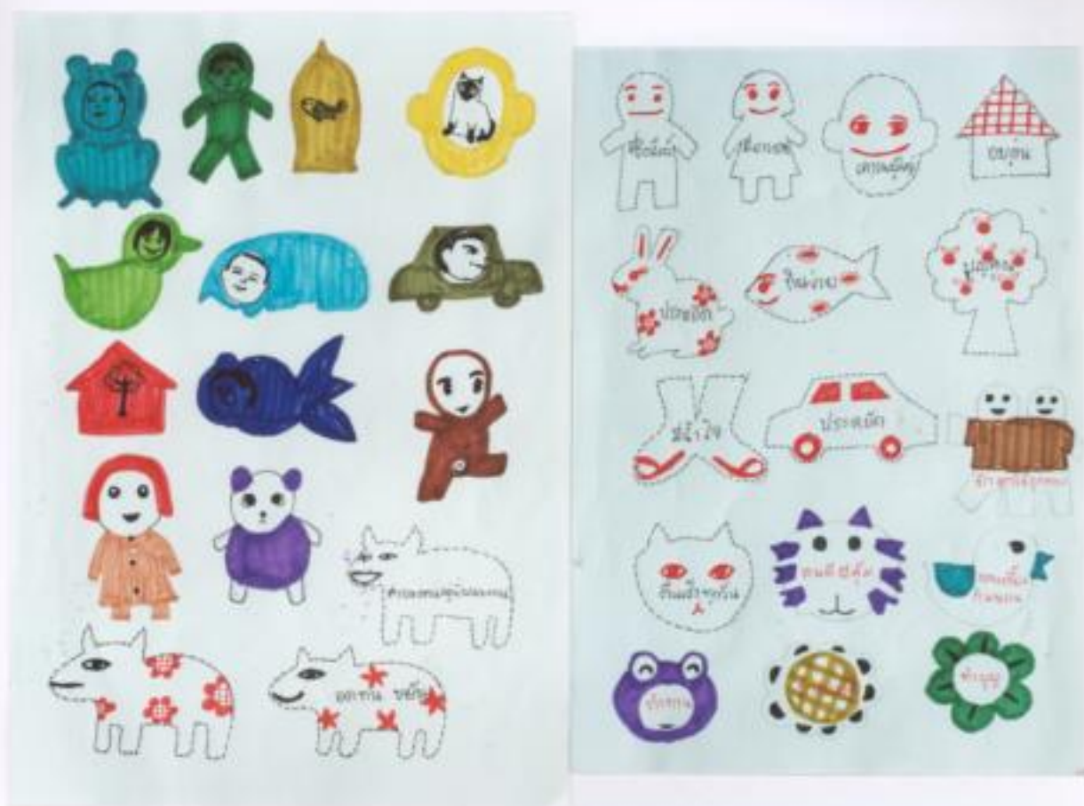
ภาพประกอบที่ 1, 2 บล๊อคพิมพ์ขนม