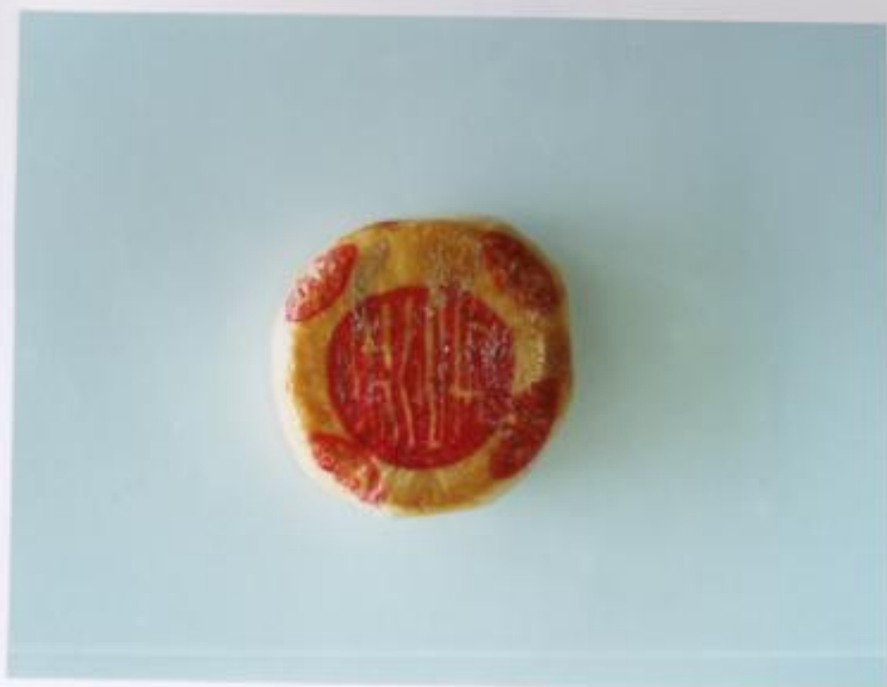
ภาพประกอบที่ 3 ลายพิมพ์บนขนม