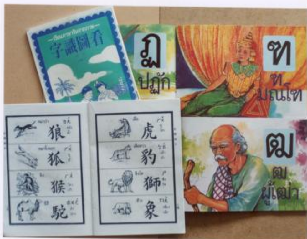
ภาพประกอบที่ 4 ตัวหนังสือจีน, ไทย