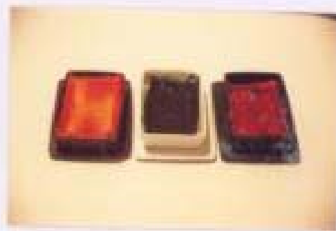
ภาพประกอบที่ 2 สี

3. สี สีมีส่วนสำคัญอย่างมากในงานเพราะข้าพเจ้าใช้บอกถึงความรู้สึก และวัฒนธรรมที่เด่นชัด สีที่ข้าพเจ้าใช้ส่วนใหญ่เป็นสีที่ใช้ทางพิธีกรรมที่ปรากฏในงาน เทศกาลหรือประเพณีต่างๆ เช่น สีแดงในประเพณีของคนจีน สีเหลืองในประเพณีของคนไทย สีดำเป็นสีหลักในงานภาพพิมพ์ใช้สืบทอดกันมาจนเป็นประเพณีซึ่งสีเหล่านี้ ข้าพเจ้าผูกพันและพบเห็นเป็นประจำ สีที่ข้าพเจ้าใช้เป็นสีผสมอาหาร