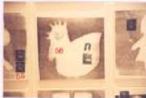
ภาพประกอบที่ 4 น้ำหนัก

5. น้ำหนัก การใช้น้ำหนักในตัวเองงานข้าพเจ้าใช้พื้นล่างของตัวเองงานมีน้ำหนักอ่อนกว่าแล้วพิมพ์น้ำหนักที่มีความเข้มลงไปเพื่อเน้นความหมายที่แฝงอยู่ในงาน เช่น พื้นล่าง ข้าพเจ้าใช้สีของแป้งทำขนมสีขาวที่แสดงถึงความบริสุทธิ์เป็นธรรมชาติ ส่วนภาพที่จะพิมพ์ทับลงไปข้าพเจ้าเลือกใช้สีแดงที่เป็นสีของเลือด ที่บ่งบอกถึงความบริสุทธิ์ผิดแผก เกิดจากการประกอบกรรมดีซึ่งประเพณีวัฒนธรรมส่วนใหญ่ก็มุ่งเน้นที่จะส่งเสริมให้ชีวิตเป็นไปเช่นนั้น โดยถ่ายทอดผ่านสายเลือดจากรุ่นหนึ่งผ่านมาสู่อีกรุ่นหนึ่ง