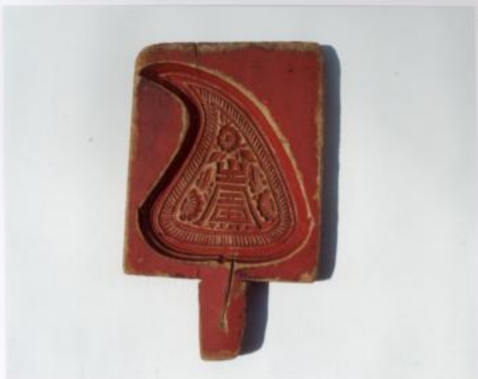
ภาพประกอบที่ 1 แม่พิมพ์ของยาย