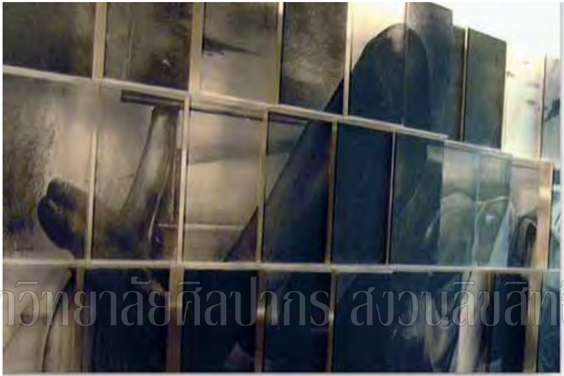
ภาพที่ 19 รายละเอียดผลงานวิทยานิพนธ์ ชั้นที่ 2