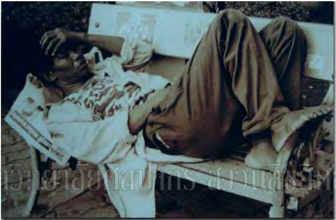
ภาพที่ 1 ข้อมูลจากภาพถ่าย