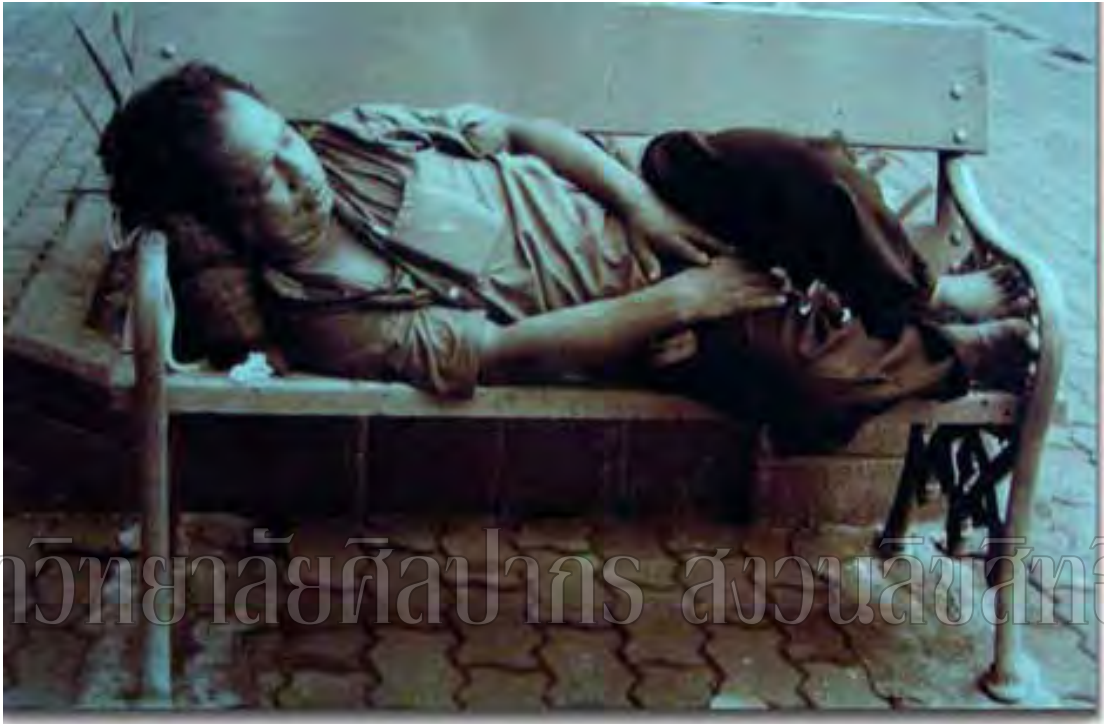
ภาพที่ 2 ข้อมูลจากภาพถ่าย