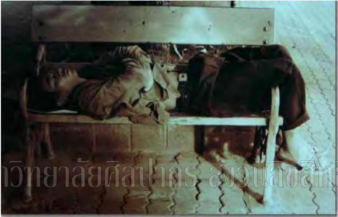
ภาพที่ 4 ข้อมูลจากภาพถ่าย