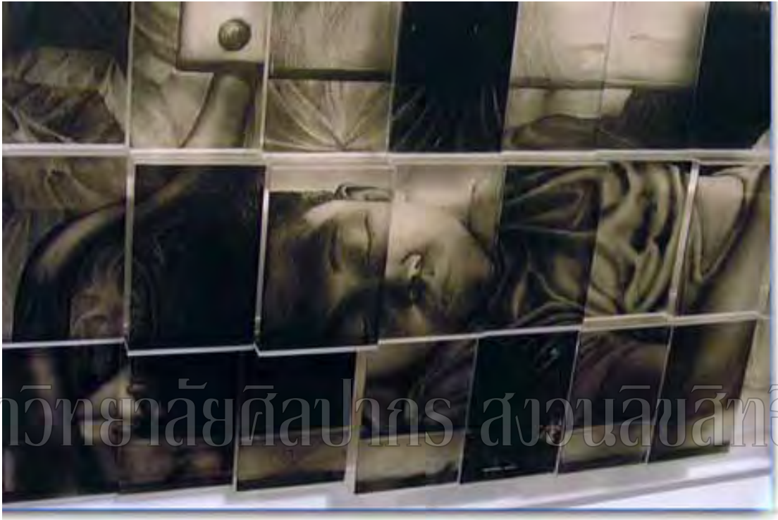
ภาพที่ 15 รายละเอียดผลงานวิทยานิพนธ์ ชั้นที่ 1