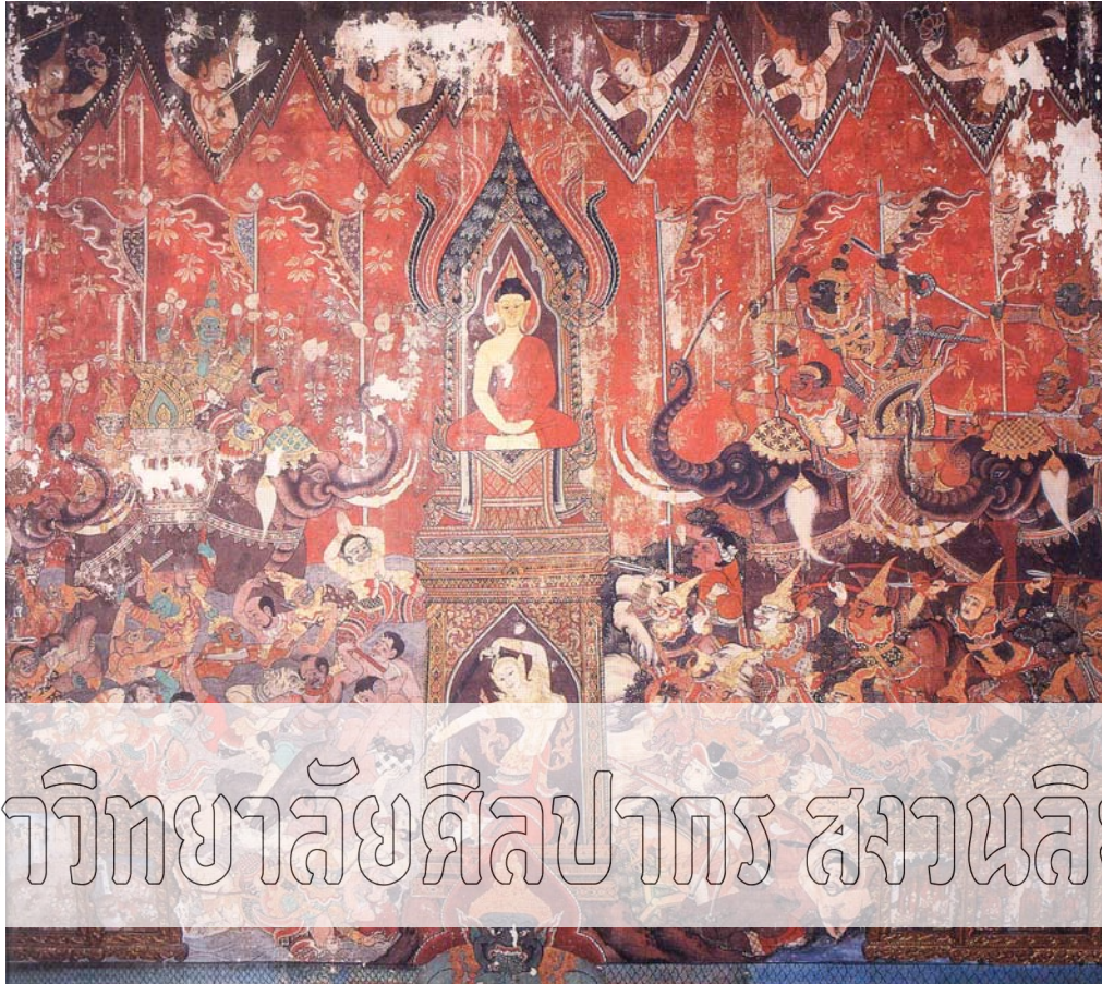
Peinture murale au temple Dusitdaram, Thonburi (Scène du Bouddha affrontant le Mara)