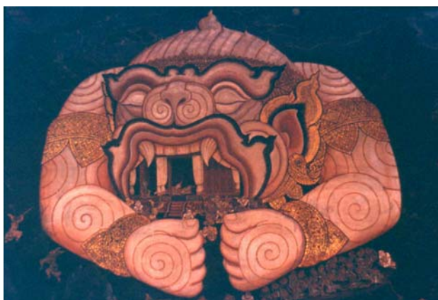
Peinture murale aux galeries du Temple du Bouddha d'Emeraude, Bangkok (des scènes de Ramakien ou version thaïe du Ramayana)